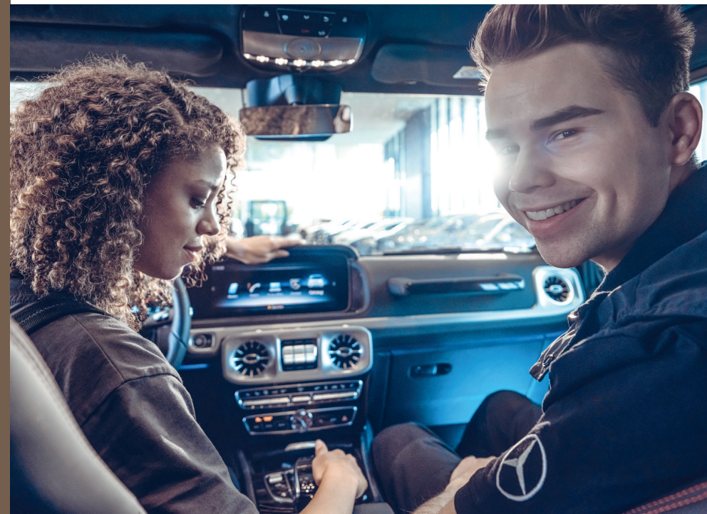
Entdeckt die Welt von Mercedes-Benz in verschiedenen Berufen!

Wollt Ihr mal schauen, was Merbag so drauf hat? Dann los, ich zeig's Euch.